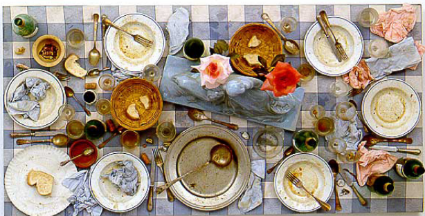
Daniel Spoerri: An Anecdoted Topography of Food

In musea zie je soms ook kunstwerken die door kunstenaars gemaakt zijn van 'rommel' of van dingen die zij verzameld hebben. Een paar voorbeelden: