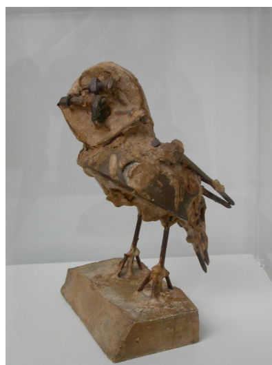
Pablo Picasso, Petite chouette, Uiltje, 1951 - 1953 Materiaal: gips, keramiek, metaal, schellak