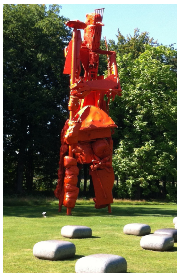
David Bade, Ins Blaue, 2012, gemengde techniek. Collectie Museum de Fundatie, Heino/Wijhe en Zwolle.