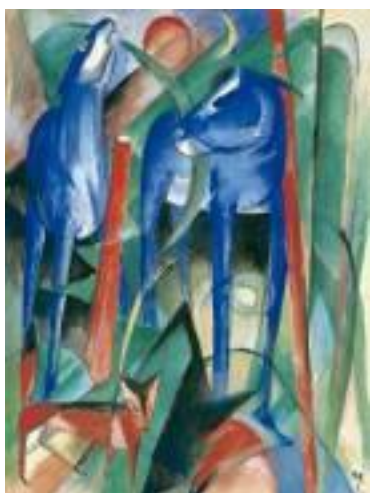
Frans Marc, De schepping van de paarden, 1913, gouache en aquarel op papier, Museum de Fundatie, Zwolle

Vanaf 1900 is voor veel kunstenaars het uitdrukken van emoties in kunst zó belangrijk, dat alles ervoor moest wijken. Deze stroming in dans, muziek en beeldende kunst heet expressionisme . Binnen de schilderkunst van het expressionisme zijn er drie schildersgroepen aan te wijzen: Der Blaue Reiter , Fauvisme en Die Brücke . Der Blaue Reiter, waartoe de kunstenaar Franz Marc behoort, kiest voor spirituele onderwerpen.