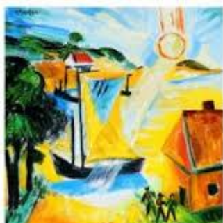
Max Pechstein, Landschap met opgaande zon, jaartal onbekend (begin 20 ste eeuw), olieverf op doek, Museum de Fundatie, Zwolle

Bij welke stroming hoort dit werk en waarom?