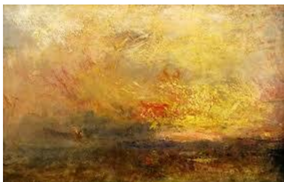
William Turner, "Wolken en water", ca. 1840 olieverf op doek, Museum de Fundatie, Zwolle