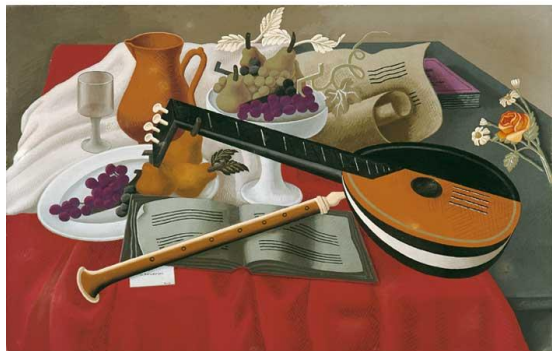
Gino Severini, Stilleven met luit , 1920, tempera op doek, Museum de Fundatie, Zwolle

Bij welke stroming hoort dit werk en waarom?