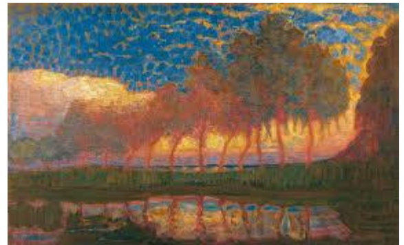
Piet Mondriaan, Bomen aan de Gein , 1907-1908, olieverf op doek, Museum de Fundatie, Zwolle

“Bomen aan het Gein” van Piet Mondriaan valt onder het luminisme (van Latijn: lumen = licht). Postimpressionisme en luminisme hebben gemeen dat het niet om een exacte weergave van de werkelijkheid gaat.