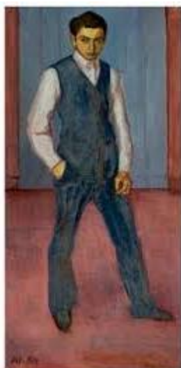
Paul Citroen, Zelfportret, olieverf op doek, 1914, Museum de Fundatie, Zwolle

Deze zelfverzekerdheid was niet van lange duur. Toen hij in contact kwam met 'Die Brücke' en 'Der Blaue Reiter' was hij in shock en tegelijkertijd onder de indruk. Citroen was klassiek opgeleid en voelde zich aangetrokken tot de traditie van het naturalisme. Tegelijkertijd wilde hij zijn aansluiting bij de avant-garde vasthouden en 'modern' zijn. Hij stopte tijdelijk met schilderen.