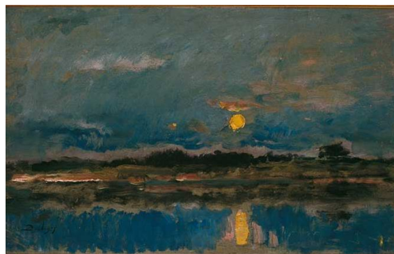
Charles-Francois Daubigny "Landschap bij maanlicht", olieverf op paneel, ca. 1875, Museum de Fundatie, Zwolle

Je zou de schilderijen van Turner (Engelse romantiek) en Daubigny (School van Barbizon) zo tussen de moderne kunst kunnen plaatsten. Beide schilders worden dan ook gerekend tot voorlopers van de moderne kunst, van het impressionisme.